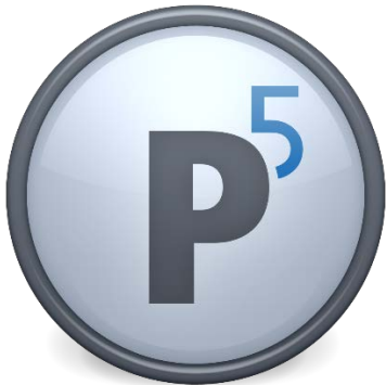
Logo Archiware P5 Software Suite

https://www.dropbox.com/s/9hzqfj484gaqf7i/P5-1024.png