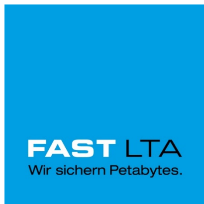
Logo FAST LTA

(png-Datei – Quelle: Archiware GmbH, Bildrechte: zur redaktionellen Verwendung frei.)