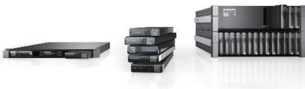
Silent Brick System